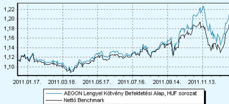
EGY JEGYRE JUTÓ NETTÓ ESZKÖZÉRTÉK, 2011.01.01 - 2011.12.31

Az alapok múltbeli teljesítménye nem nyújt garanciát a jövőbeli hozamok nagyságára. Jelen hirdetés nem minősül ajánlattételnek vagy befektetési tanácsadásnak. A befektetés részletes feltételeit az Alap Tájékoztatója tartalmazza, mely a mindenkor érvényes kondíciós listákkal együtt megtalálható a forgalmazási helyeken. A befektetési alap forgalmazásával (vétel, tartás, eladás) kapcsolatos költségek az alap kezelési szabályzatában és a forgalmazási helyeken megismerhetők.