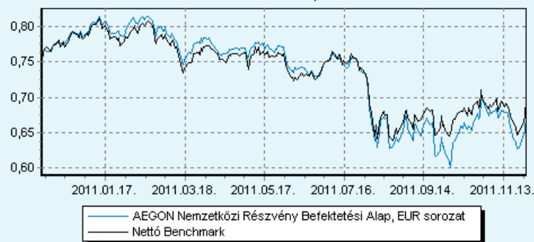
EGY JEGYRE JUTÓ NETTÓ ESZKÖZÉRTÉK, 2010.12.01 - 2011.11.30

Az alapok múltbeli teljesítménye nem nyújt garanciát a jövőbeli hozamok nagyságára. Jelen hirdetés nem minősül ajánlattételnek vagy befektetési tanácsadásnak. A befektetés részletes feltételeit az Alap Tájékoztatója tartalmazza, mely a mindenkor érvényes kondíciós listákkal együtt megtalálható a forgalmazási helyeken. A befektetési alap forgalmazásával (vétel, tartás, eladás) kapcsolatos költségek az alap kezelési szabályzatában és a forgalmazási helyeken megismerhetők.