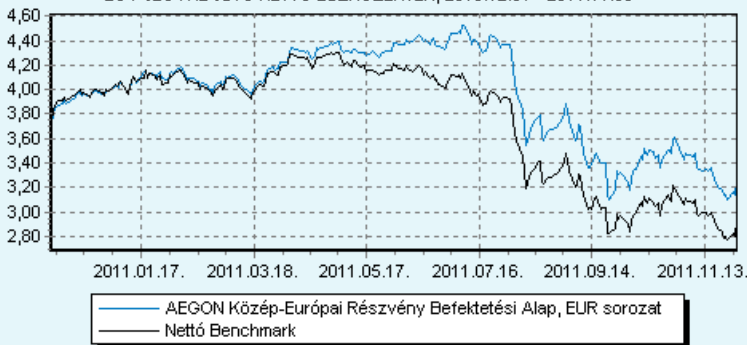
EGY JEGYRE JUTÓ NETTÓ ESZKÖZÉRTÉK, 2010.12.01 - 2011.11.30

Az alapok múltbeli teljesítménye nem nyújt garanciát a jövőbeli hozamok nagyságára. Jelen hirdetés nem minősül ajánlattételnek vagy befektetési tanácsadásnak. A befektetés részletes feltételeit az Alap Tájékoztatója tartalmazza, mely a mindenkor érvényes kondíciós listákkal együtt megtalálható a forgalmazási helyeken. A befektetési alap forgalmazásával (vétel, tartás, eladás) kapcsolatos költségek az alap kezelési szabályzatában és a forgalmazási helyeken megismerhetők.