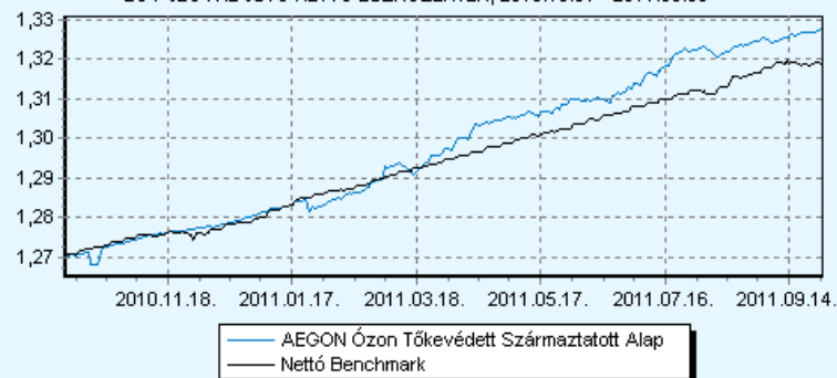
EGY JEGYRE JUTÓ NETTÓ ESZKÖZÉRTÉK, 2010.10.01 - 2011.09.30

Az alapok múltbeli teljesítménye nem nyújt garanciát a jövőbeli hozamok nagyságára. Jelen hirdetés nem minősül ajánlattételnek vagy befektetési tanácsadásnak. A befektetés részletes feltételeit az Alap Tájékoztatója tartalmazza, mely a mindenkor érvényes kondíciós listákkal együtt megtalálható a forgalmazási helyeken. A befektetési alap forgalmazásával (vétel, tartás, eladás) kapcsolatos költségek az alap kezelési szabályzatában és a forgalmazási helyeken megismerhetők.