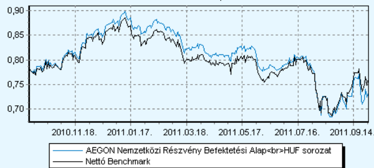
EGY JEGYRE JUTÓ NETTÓ ESZKÖZÉRTÉK, 2010.10.01 - 2011.09.30

Az alapok múltbeli teljesítménye nem nyújt garanciát a jövőbeli hozamok nagyságára. Jelen hirdetés nem minősül ajánlattételnek vagy befektetési tanácsadásnak. A befektetés részletes feltételeit az Alap Tájékoztatója tartalmazza, mely a mindenkor érvényes kondíciós listákkal együtt megtalálható a forgalmazási helyeken. A befektetési alap forgalmazásával (vétel, tartás, eladás) kapcsolatos költségek az alap kezelési szabályzatában és a forgalmazási helyeken megismerhetők.