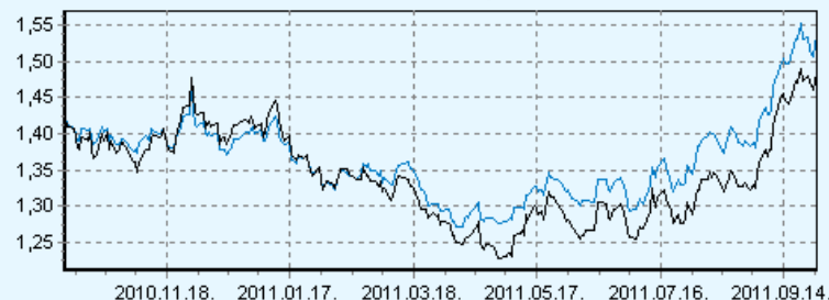
EGY JEGYRE JUTÓ NETTÓ ESZKÖZÉRTÉK, 2010.10.01 - 2011.09.30

Az alapok múltbeli teljesítménye nem nyújt garanciát a jövőbeli hozamok nagyságára. Jelen hirdetés nem minősül ajánlattételnek vagy befektetési tanácsadásnak. A befektetés részletes feltételeit az Alap Tájékoztatója tartalmazza, mely a mindenkor érvényes kondíciós listákkal együtt megtalálható a forgalmazási helyeken. A befektetési alap forgalmazásával (vétel, tartás, eladás) kapcsolatos költségek az alap kezelési szabályzatában és a forgalmazási helyeken megismerhetők.