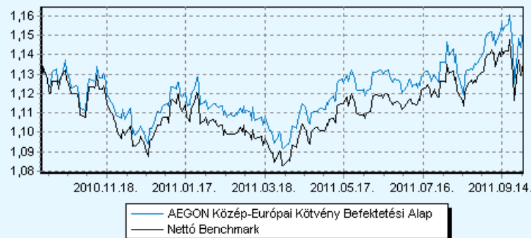
EGY JEGYRE JUTÓ NETTÓ ESZKÖZÉRTÉK, 2010.10.01 - 2011.09.30

Az alapok múltbeli teljesítménye nem nyújt garanciát a jövőbeli hozamok nagyságára. Jelen hirdetés nem minősül ajánlattételnek vagy befektetési tanácsadásnak. A befektetés részletes feltételeit az Alap Tájékoztatója tartalmazza, mely a mindenkor érvényes kondíciós listákkal együtt megtalálható a forgalmazási helyeken. A befektetési alap forgalmazásával (vétel, tartás, eladás) kapcsolatos költségek az alap kezelési szabályzatában és a forgalmazási helyeken megismerhetők.