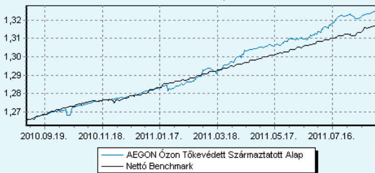
EGY JEGYRE JUTÓ NETTÓ ESZKÖZÉRTÉK, 2010.09.01 - 2011.08.31

Az alapok múltbéli teljesítménye nem nyújt garanciát a jövőbeli hozamok nagyságára. Jelen hirdetés nem minősül ajánlattételnek vagy befektetési tanácsadásnak. A befektetés részletes feltételeit az Alap Tájékoztatója tartalmazza, mely a mindenkor érvényes kondíciós listákkal együtt megtalálható a forgalmazási helyeken. A befektetési alap forgalmazásával (vétel, tartás, eladás) kapcsolatos költségek az alap kezelési szabályzatában és a forgalmazási helyeken megismerhetők.