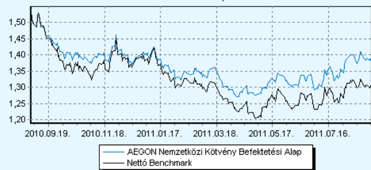
EGY JEGYRE JUTÓ NETTÓ ESZKÖZÉRTÉK, 2010.09.01 - 2011.08.31

Az alapok múltbeli teljesítménye nem nyújt garanciát a jövőbeli hozamok nagyságára. Jelen hirdetés nem minősül ajánlattételnek vagy befektetési tanácsadásnak. A befektetés részletes feltételeit az Alap Tájékoztatója tartalmazza, mely a mindenkor érvényes kondíciós listákkal együtt megtalálható a forgalmazási helyeken. A befektetési alap forgalmazásával (vétel, tartás, eladás) kapcsolatos költségek az alap kezelési szabályzatában és a forgalmazási helyeken megismerhetők.