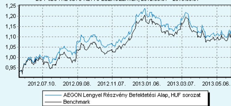
EGY JEGYRE JUTÓ NETTÓ ESZKÖZÉRTÉK, 2012.06.01 - 2013.05.31

A múltbeli hozamok nem jelentenek garanciát az alap jövőbeli teljesítményére nézve. Jelen hirdetés nem minősül ajánlattételnek vagy befektetési tanácsadásnak. A befektetés részletes feltételeit az Alap Tájékoztatója tartalmazza, mely a mindenkor érvényes kondíciós listákkal együtt megtalálható a forgalmazási helyeken. A befektetési alap forgalmazásával (vétel, tartás, eladás) kapcsolatos költségek az alap kezelési szabályzatában és a forgalmazási helyeken megismerhetők.