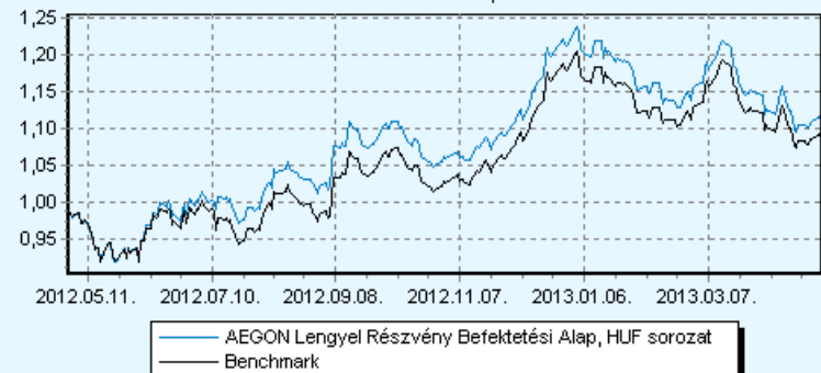
EGY JEGYRE JUTÓ NETTÓ ESZKÖZÉRTÉK, 2012.05.01 - 2013.04.30

Az alapok múltbeli teljesítménye nem nyújt garanciát a jövőbeli hozamok nagyságára. Jelen hirdetés nem minősül ajánlattételnek vagy befektetési tanácsadásnak. A befektetés részletes feltételeit az Alap Tájékoztatója tartalmazza, mely a mindenkor érvényes kondíciós listákkal együtt megtalálható a forgalmazási helyeken. A befektetési alap forgalmazásával (vétel, tartás, eladás) kapcsolatos költségek az alap kezelési szabályzatában és a forgalmazási helyeken megismerhetők.