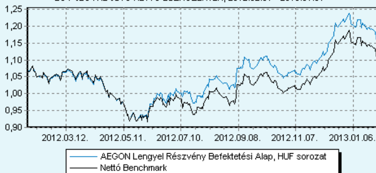
EGY JEGYRE JUTÓ NETTÓ ESZKÖZÉRTÉK, 2012.02.01 - 2013.01.31

Az alapok múltbeli teljesítménye nem nyújt garanciát a jövőbeli hozamok nagyságára. Jelen hirdetés nem minősül ajánlattételnek vagy befektetési tanácsadásnak. A befektetés részletes feltételeit az Alap Tájékoztatója tartalmazza, mely a mindenkor érvényes kondíciós listákkal együtt megtalálható a forgalmazási helyeken. A befektetési alap forgalmazásával (vétel, tartás, eladás) kapcsolatos költségek az alap kezelési szabályzatában és a forgalmazási helyeken megismerhetők.