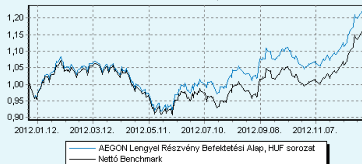
EGY JEGYRE JUTÓ NETTÓ ESZKÖZÉRTÉK, 2012.01.03 - 2012.12.31

Az alapok múltbeli teljesítménye nem nyújt garanciát a jövőbeli hozamok nagyságára. Jelen hirdetés nem minősül ajánlattételnek vagy befektetési tanácsadásnak. A befektetés részletes feltételeit az Alap Tájékoztatója tartalmazza, mely a mindenkor érvényes kondíciós listákkal együtt megtalálható a forgalmazási helyeken. A befektetési alap forgalmazásával (vétel, tartás, eladás) kapcsolatos költségek az alap kezelési szabályzatában és a forgalmazási helyeken megismerhetők.