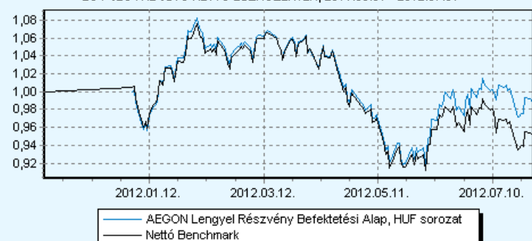
EGY JEGYRE JUTÓ NETTÓ ESZKÖZÉRTÉK, 2011.08.01 - 2012.07.31

Az alapok múltbeli teljesítménye nem nyújt garanciát a jövőbeli hozamok nagyságára. Jelen hirdetés nem minősül ajánlattételnek vagy befektetési tanácsadásnak. A befektetés részletes feltételeit az Alap Tájékoztatója tartalmazza, mely a mindenkor érvényes kondíciós listákkal együtt megtalálható a forgalmazási helyeken. A befektetési alap forgalmazásával (vétel, tartás, eladás) kapcsolatos költségek az alap kezelési szabályzatában és a forgalmazási helyeken megismerhetők.