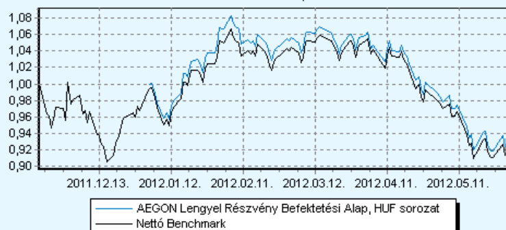
EGY JEGYRE JUTÓ NETTÓ ESZKÖZÉRTÉK, 2011.06.01 - 2012.05.31

Az alapok múltbeli teljesítménye nem nyújt garanciát a jövőbeli hozamok nagyságára. Jelen hirdetés nem minősül ajánlattételnek vagy befektetési tanácsadásnak. A befektetés részletes feltételeit az Alap Tájékoztatója tartalmazza, mely a mindenkor érvényes kondíciós listákkal együtt megtalálható a forgalmazási helyeken. A befektetési alap forgalmazásának (vétel, tartás, eladás) kapcsolatos költségek az alap kezelési szabályzatában és a forgalmazási helyeken megismerhetők.