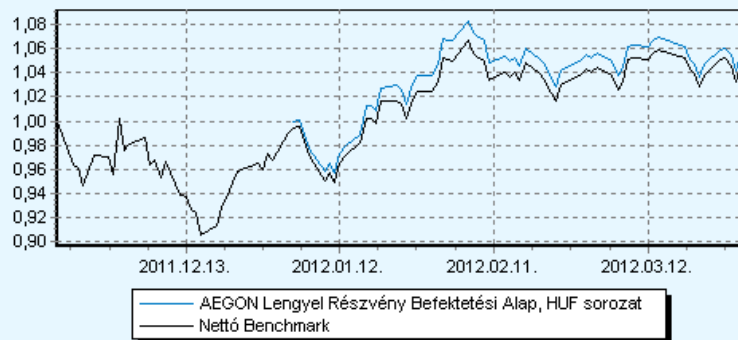
EGY JEGYRE JUTÓ NETTÓ ESZKÖZÉRTÉK, 2011.04.01 - 2012.03.31

Az alapok múltbeli teljesítménye nem nyújt garanciát a jövőbeli hozamok nagyságára. Jelen hirdetés nem minősül ajánlattételnek vagy befektetési tanácsadásnak. A befektetés részletes feltételeit az Alap Tájékoztatója tartalmazza, mely a mindenkor érvényes kondíciós listákkal együtt megtalálható a forgalmazási helyeken. A befektetési alap forgalmazásával (vétel, tartás, eladás) kapcsolatos költségek az alap kezelési szabályzatában és a forgalmazási helyeken megismerhetők.