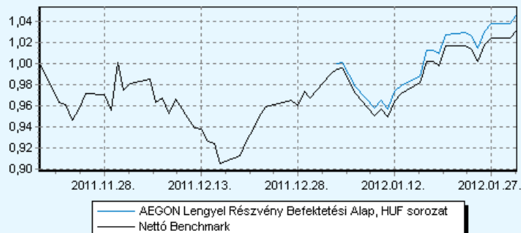
EGY JEGYRE JUTÓ NETTÓ ESZKÖZÉRTÉK, 2011.02.01 - 2012.01.31

Az alapok múltbeli teljesítménye nem nyújt garanciát a jövőbeli hozamok nagyságára. Jelen hirdetés nem minősül ajánlattételnek vagy befektetési tanácsadásnak. A befektetés részletes feltételeit az Alap Tájékoztatója tartalmazza, mely a mindenkor érvényes kondíciós listákkal együtt megtalálható a forgalmazási helyeken. A befektetési alap forgalmazásával (vétel, tartás, eladás) kapcsolatos költségek az alap kezelési szabályzatában és a forgalmazási helyeken megismerhetők.