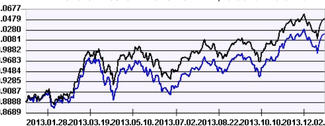
EGY JEGYRE JUTÓ NETTÓ ESZKÖZÉRTÉK, 2013.01.01 - 2013.12.31

----- AEGON Nemzetközi Részvény Befektetési Alap HUF sorozat ----- Benchmark