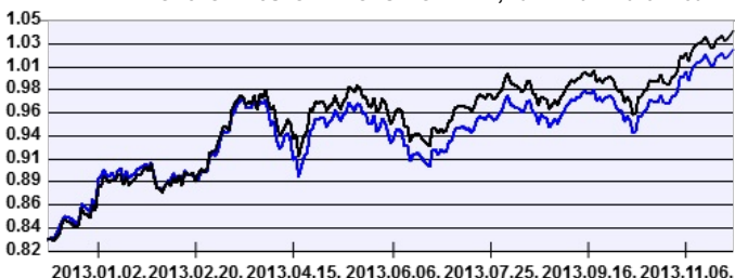
EGY JEGYRE JUTÓ NETTÓ ESZKÖZÉRTÉK, 2012.12.01 - 2013.11.30

----- AEGON Nemzetközi Részvény Befektetési Alap HUF sorozat ----- Benchmark