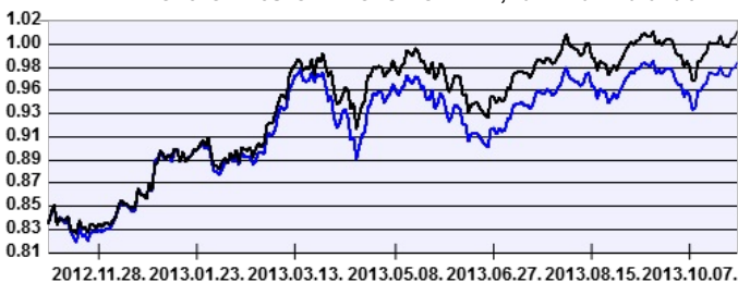
EGY JEGYRE JUTÓ NETTÓ ESZKÖZÉRTÉK, 2012.11.01 - 2013.10.31

----- AEGON Nemzetközi Részvény Befektetési Alap HUF sorozat ----- Benchmark