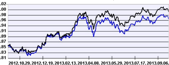
EGY JEGYRE JUTÓ NETTÓ ESZKÖZÉRTÉK, 2012.10.01 - 2013.09.30

----- AEGON Nemzetközi Részvény Befektetési Alap HUF sorozat ----- Benchmark